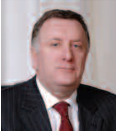
Rory Brady, SC Ard-Aighne

Cúis áthais dom Tuarascáil na hOifige don bhliain 2006 a chur i láthair. Is í seo Séú Tuarascáil Bhliantúil na hOifige a foilsíodh ó ceapadh mise mar Ard-Aighne i mí an Mheithimh, 2002.